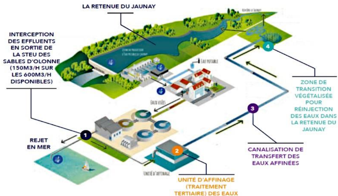
Figure 1 : Différentes étapes du projet Jourdain (Vendée Eau).

Plutôt que d'être rejeté en totalité dans l'océan Atlantique, 25% du débit disponible en sortie de la station d'épuration du Petit Plessis des Sables d'Olonne (4,5m 3 d'eau rejetée par an) sera récupéré et acheminé vers une station d'affinage pour subir un traitement tertiaire en 5 étapes afin d'éliminer la salinité, les composés microbiologiques et les micropolluants (pesticides, composés pharmaceutiques et industriels).